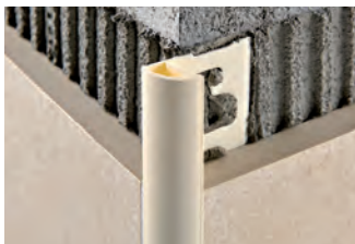
ЦВЕТНАЯ ВИНИЛОВАЯ СМОЛА длина бруска 2,7 Лин.М - упаковка 80шт. - 216 Лин.М