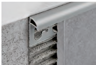
ЦВЕТНАЯ ВИНИЛОВАЯ СМОЛА длина бруска 2,7 Лин.М - упаковка 80шт. - 216 Лин.М

Имеются капсулы и трехосные соединения для внутренних и наружных углов. (исключаются отделки № 12 и 13).